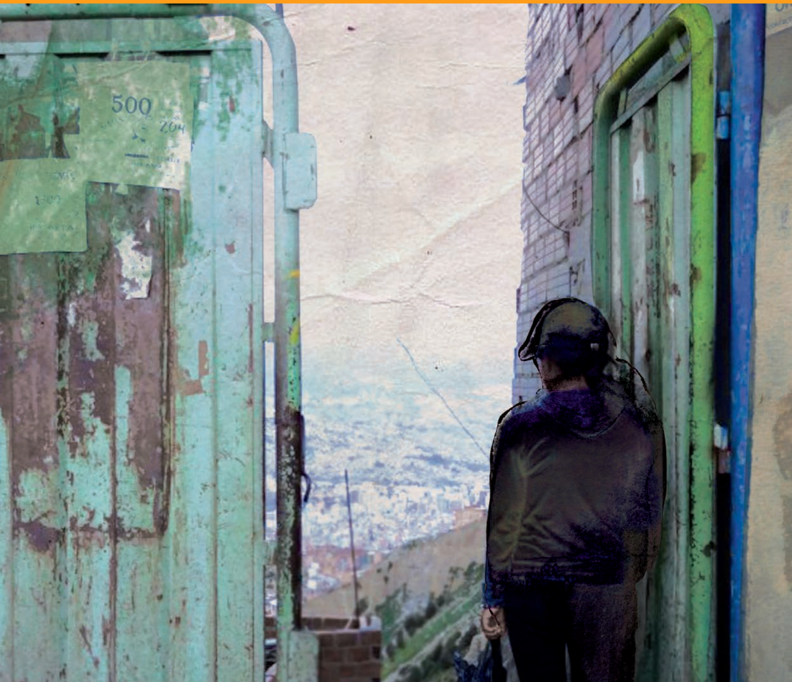
Ilustración basada en imágenes de Mabel Lozano ( Proyecto Chicas Nuevas 24 Horas )