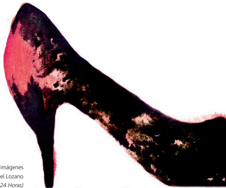
Ilustración basada en imágenes de Mabel Lozano (Proyecto Chicas Nuevas 24 Horas)

y Fronteras, conllevará la puesta en marcha de las diferentes medidas de protección, generales y específicas, que prevén tanto la Ley de Enjuiciamiento Criminal como, en el supuesto de que se trate de una persona extranjera, la Ley Orgánica 4/2000, de 11 de enero, y sus instrumentos de desarrollo.