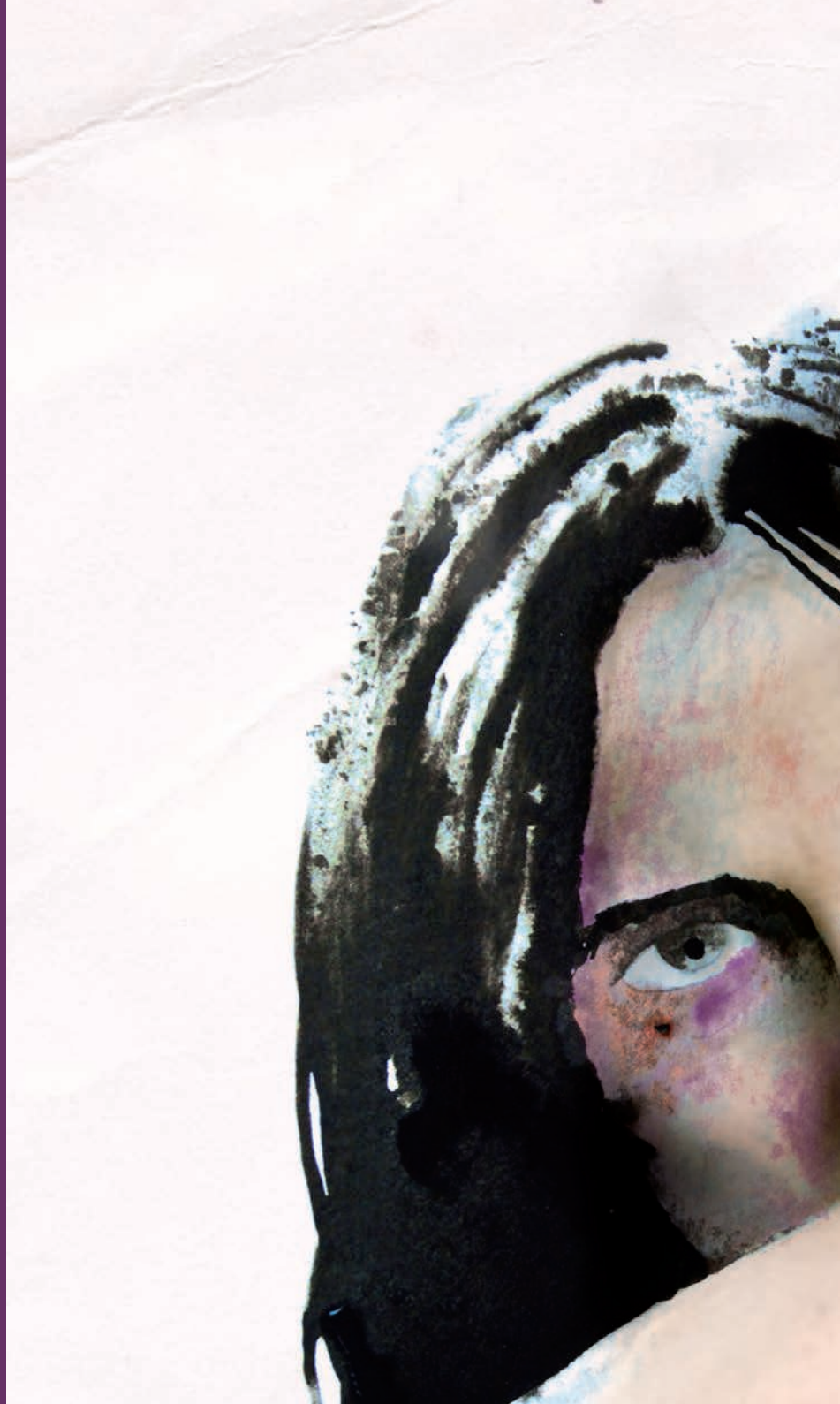
Ilustración basada en imágenes de Mabel Lozano (Proyecto Chicas Nuevas 24 Horas )