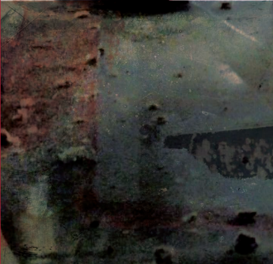
Ilustración basada en imágenes de Mabel Lozano (Proyecto Chicas Nuevas 24 Horas )