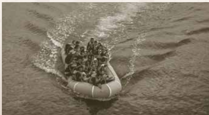
Refugiados llegando a la costa de Lesbos.

En el año 2000 la Asamblea General de las Naciones Unidas decidió que, con motivo del 50º aniversario de la Convención, a partir del año 2001 debía recordarse a las personas refugiadas con la ce-