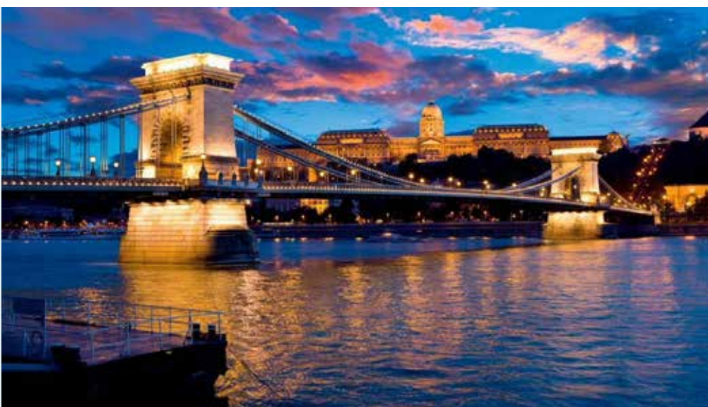
Puente de Las Cadenas y Castillo Real.

Para finalizar este recorrido, os recomendamos reservar un paseo nocturno en barco con cena. Es imprescindible disfrutar de los majestuosos edificios de Budapest iluminados desde el Danubio.