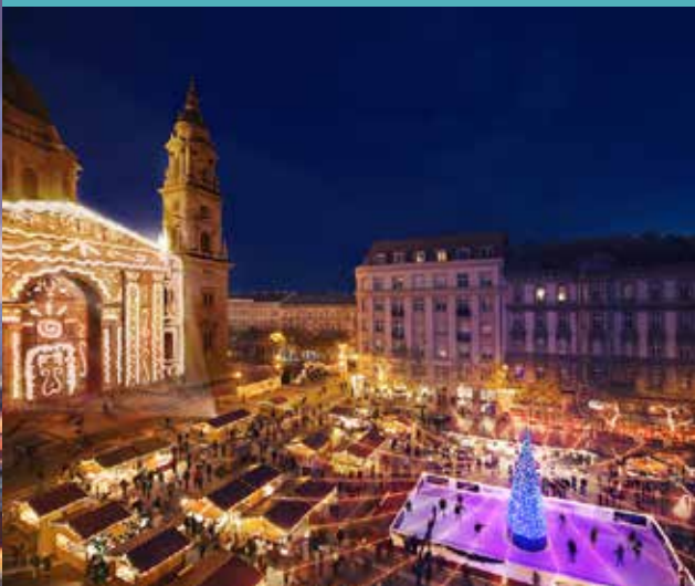
Basilica San Esteban y mercado navideño.