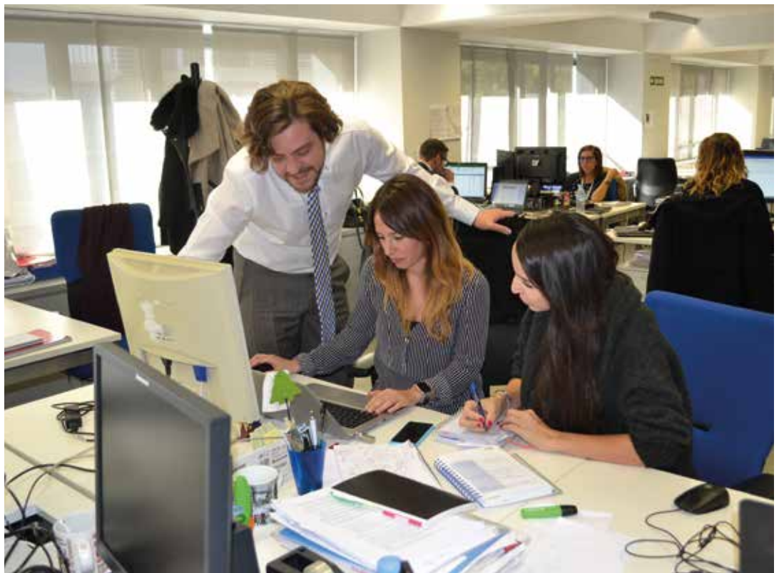
Tres técnicos del Servicio de Soporte de LexNET responden las dudas de los usuarios a través de Twitter.

la satisfacción de los profesionales que utilizan LexNET. “Rastreamos todo lo que se dice de LexNET, todo. Desde un comentario de un usuario enfadado por cómo funciona LexNET hasta un chiste sobre la plataforma”, expli-