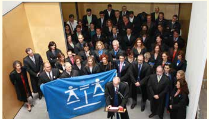
VII Edición del día de la Justicia Gratuita.