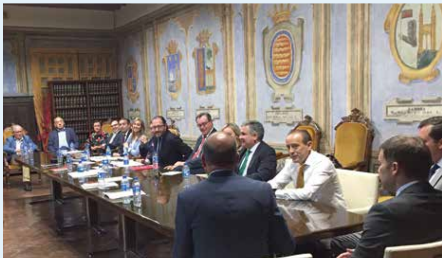
Junta de Gobierno del ICABA en el Ayuntamiento de Medina del Campo.

En el conjunto de España, a estas nuevas plazas hay que sumar las 16 de magistrado que el Gobierno aprobó el pasado mes de marzo para hacer efectiva la segunda instancia penal de manera que la creación total para este año asciende a 109 unidades, informa El Norte de Castilla.