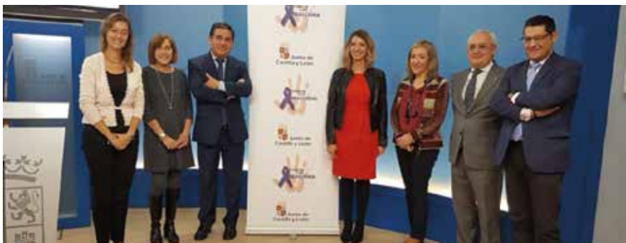
La abogacía y la Consejería de Familia e Igualdad de Oportunidades firman el convenio de colaboración.

En este caso, se podrá proceder a la presentación del escrito en el órgano u oficina judicial o fiscal el primer día hábil siguiente acompañando el justificante de dicha interrupción (artículos 12.2 y 16 del RD 1065/2015).