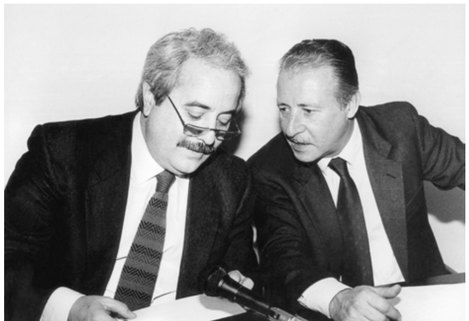
Los jueces Falcone (izquierda) y Borsellino.

El nuevo método de trabajo hacía mucho más difícil que el asesinato de uno de ellos tuviera efecto en la lucha contra la mafia,