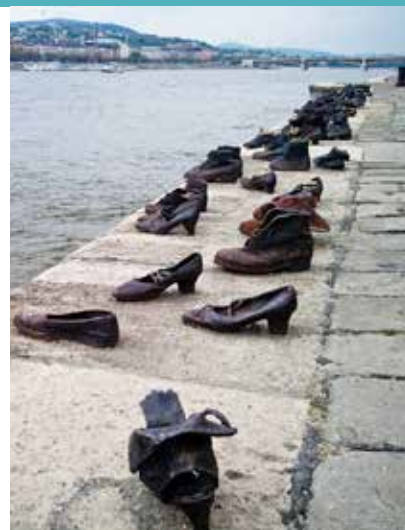
Monumento a la memoria.