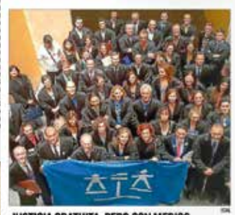
JUSTICIA GRATUITA, PERO CON MEDIOS El Colegio de Abogados celebró ayer el Día de la Justicia Gratuita con un acto en el que se reclamó a las administraciones que valoran este servicio como «ya lo hace gran parte de la ciudadanía», y que lo restituyan «de una forma digna y acorde con el trabajo que desarrollan», informa Iria.