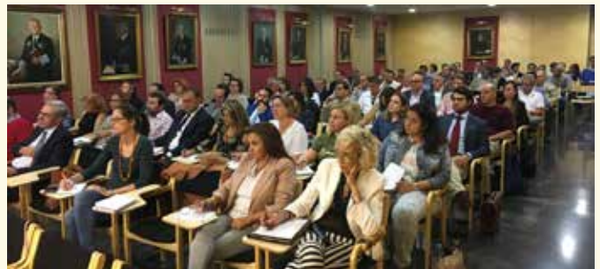
Curso sobre 'Recurso de suplicación en la Ley Reguladora de la Jurisdicción Social'.