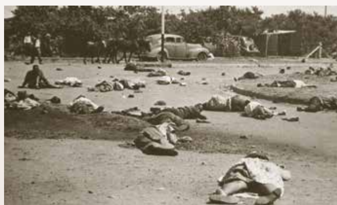
Cuerpos abatidos tras la masacre de Sharpeville.

nacional de la Eliminación de la Discriminación Racial', al tiempo que instaba a la comunidad internacional a incrementar sus esfuerzos para eliminar todas las formas de discriminación racial, racismo, intolerancia y xenofobia y luchar por la igualdad.