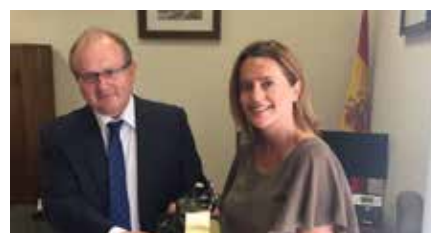
La comisión de la revista ICAVA entrega el premio.