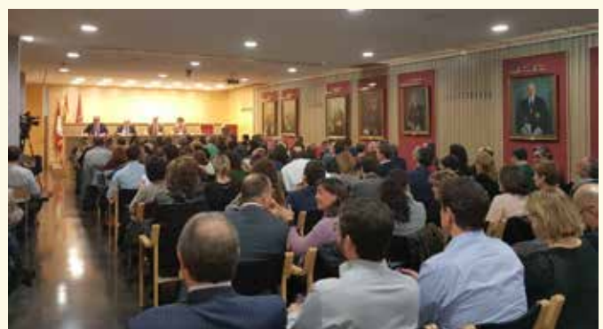
Mesa redonda sobre el Real Decreto-ley 1/2007, sobre medidas urgentes de protección de consumidores en materia de cláusulas suelo.