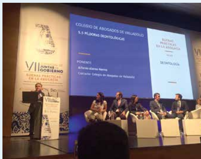
VII Jornadas de Juntas de Gobierno en Granada.

La presidente de la Abogacía ha afirmado también durante la clausura que las buenas prácticas en la Abogacía no son solo un lema, sino la expresión de un compromiso.