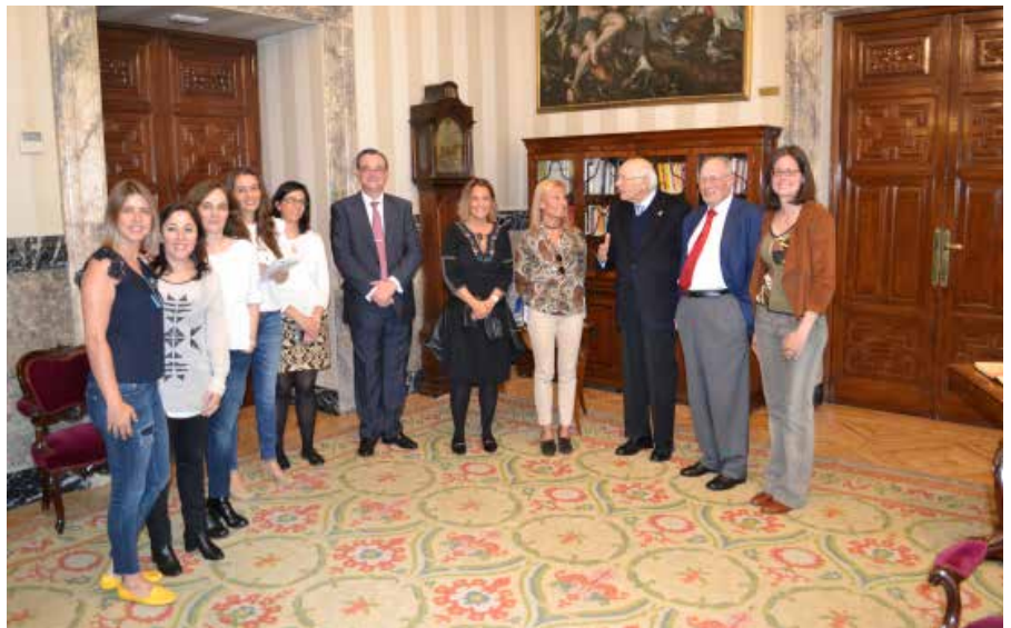
El presidente del Consejo de Estado José Manuel Romay Beccaría recibe a los abogados de Icaiva en su despacho.

Entre las resoluciones más mediáticas se encuentra la del accidente del Yakovlev-42, ocurrido en suelo turco el 26 de mayo de 2003 y en el que perdieron la vida 62 militares españoles que regresaban de una misión en Afganistán. La emisión del dictamen —el 20 de octubre de 2016, 13 años después del accidente— en el que se responsabiliza al Ministerio de Defensa, llevó a la institución a