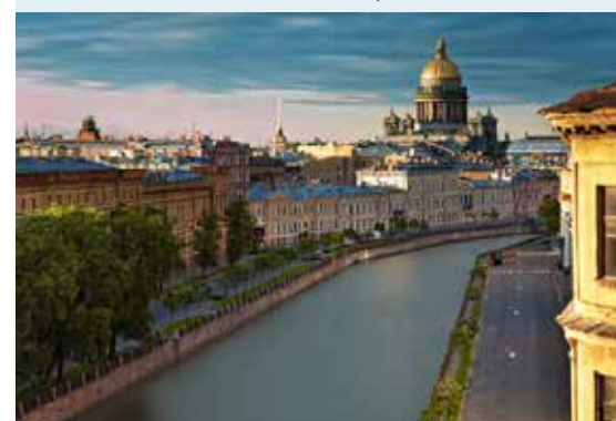
Canales y catedral de San Isaac.

subir a lo alto de la iglesia para observar unas maravillosas vistas de la ciudad.