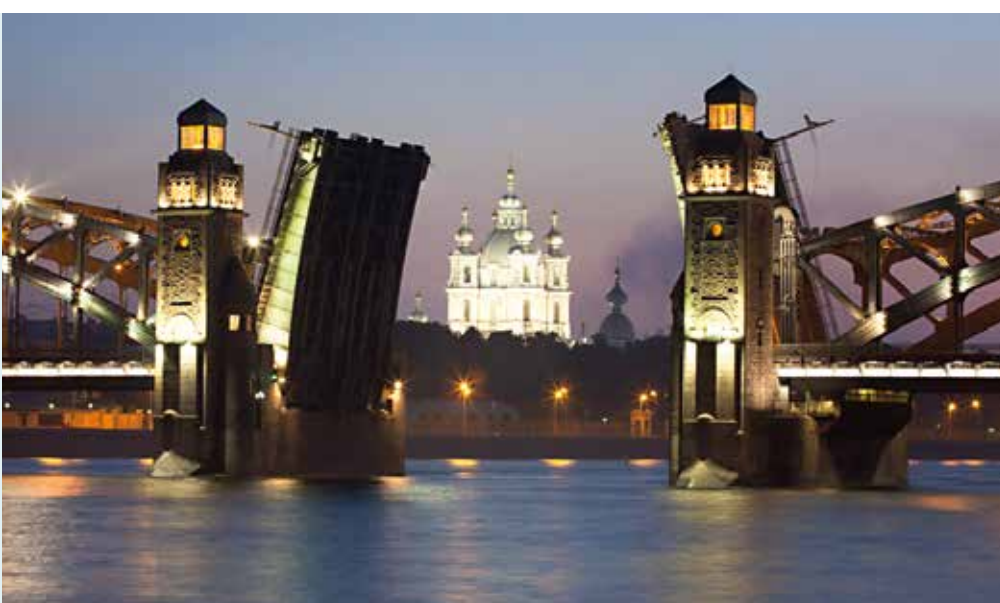
Las noches blancas.

La gastronomía rusa muy es rica y variada, hay restaurantes de todas las nacionalidades. Es imprescindible probar la comida rusa tradicional en alguno de los restaurantes locales. Sobre todo, las sopas Borsh, Soliánka, ensaladas típicas, “pelmeni”, “blinis” (crepes), ternera “Stroganoff” u otros platos rusos que le puede aconsejar la gente local. También hay algunas bebidas típicas, como la bebida caliente antigua “Sbitten”, cerveza local y el vodka. Los rusos son, curiosamente, auténticos apasionados de la comida japonesa.