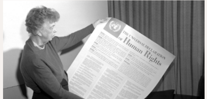
Eleanor Roosevelt sostiene una copia de la Declaración

Finalmente, el 10 de diciembre de 1948 la Asamblea General de las Naciones Unidas proclamaba la Declaración Universal de los Derechos Humanos como un ideal común para todos los pueblos y na-