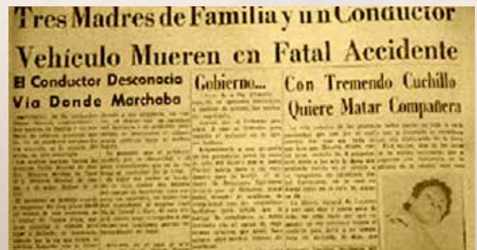
Noticia publicada en la prensa sobre la muerte de las hermanas Mirabal ( http://elgritocontenido.blogspot.com.es/2015/08/las-hermanas-mirabal-y-su-chofer-rufino.html )

Inicialmente fue el movimiento feminista latinoamericano el que decidió fijar la fecha del aniversario de la muerte de las hermanas Mirabal para homenajearlas, pero en 1999 la Organización de las Naciones Unidas, que calcula que hasta un 70% de las mujeres sufren violencia a lo largo de su vida, se sumó a la jornada reivindicativa y declaró el 25 de noviembre Día Internacional para la Eliminación de la Violencia contra la Mujer.