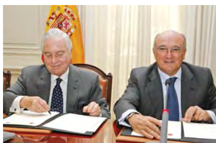
Carlos Divar, presidente del CGPJ y Carlos Carnicer, presidente del CGAE en la firma, el 17 de febrero de 2010, del convenio de colaboración entre ambos organismos.

El convenio suscrito comprende también acciones en ámbitos como la formación, las medidas disciplinarias o la creación de foros conjuntos de colaboración en materias específicas, tales como familia y fomento de la mediación como solución alternativa de litigios, donde poner en común dificultades y objetivos.