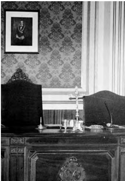
Sala postdictatorial. Crucifijo en la mesa con el mismo rango funcional del vade, el cenicero, el micrófono, la campanilla. Instrumentos todos de trabajo.

raba que "Jura es averiguamiento que se faze, nombrando a Dios, o a alguna otra cosa santa, sobre que alguno afirma que es assí, o lo niega" . Casi nueve siglos después, "juramento" sigue siendo prácticamente lo mismo: "Afirmación o negación de algo, poniendo por testigo a Dios, o en sí mismo o en sus criaturas" . 5