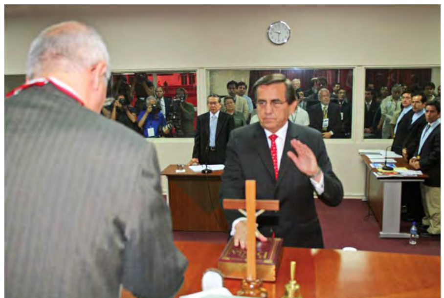
Jura del testigo Jorge del Castillo en el juicio contra Alberto Fujimori.

Durante la incompletamente olvidada dictadura próxima pasada, no colgaban, al parecer, cristos en las paredes de las salas de vistas, pero sí en las de otros no menos nobles aposentos. Por Orden de 30 de marzo de 1939, 12 el entonces ministro de Educación, Pedro Sainz Rodríguez, dispuso que el Santo Crucifijo fuese instaurado en el lugar preferente de cada una de las aulas y salas de trabajo, tanto de los centros universitarios