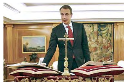
José Luis Rodríguez Zapatero promete el cargo de presidente del gobierno español el 12 de abril de 2008.

No he seguido la historia de los crucifijos en las salas de audiencia italianas, y no sé en qué habrá quedado la cosa. El gobierno italiano, a raíz de la citada resolución del Tribunal de Estrasburgo sobre la presencia de los crucifijos en los centros docentes, manifestó que defendería ante las instituciones europeas su potestad soberana de exhibir en los lugares públicos, los signos religiosos que crea convenientes. Italia no es España y, por lo tanto, no puede asegurarse que los crucifijos de las salas de vistas termi-