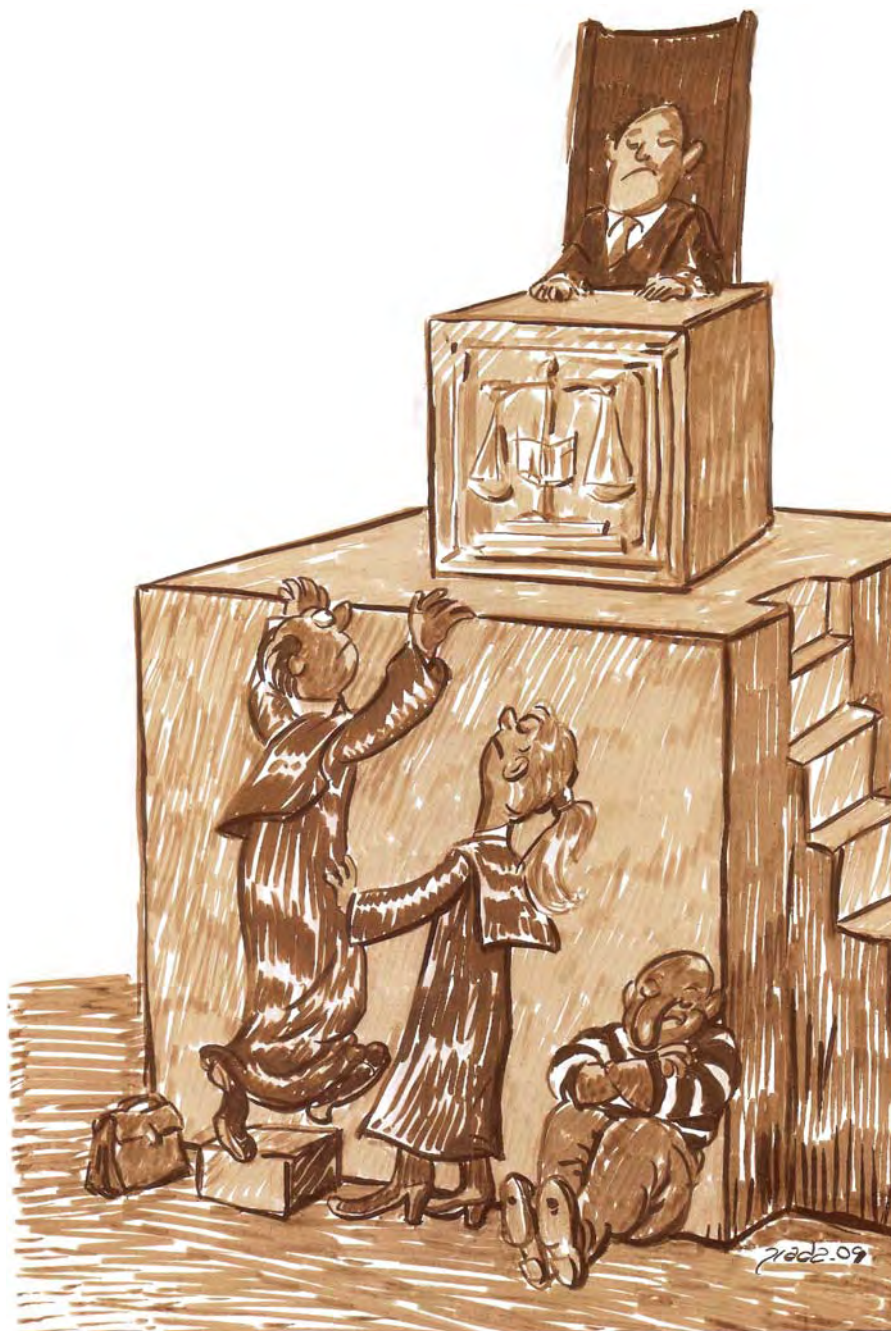
– Con la venia de su Señoría Altísima.

cosas, ordena: “Otro sí mientras el Rey estuviere en pie, lo deven honrrar non se le queriendo igualar nin ser en logar más alto que el, para mostrarle sus razones, mas deven catar lugar baxo o fincar los inojos ante él humildosamente”.