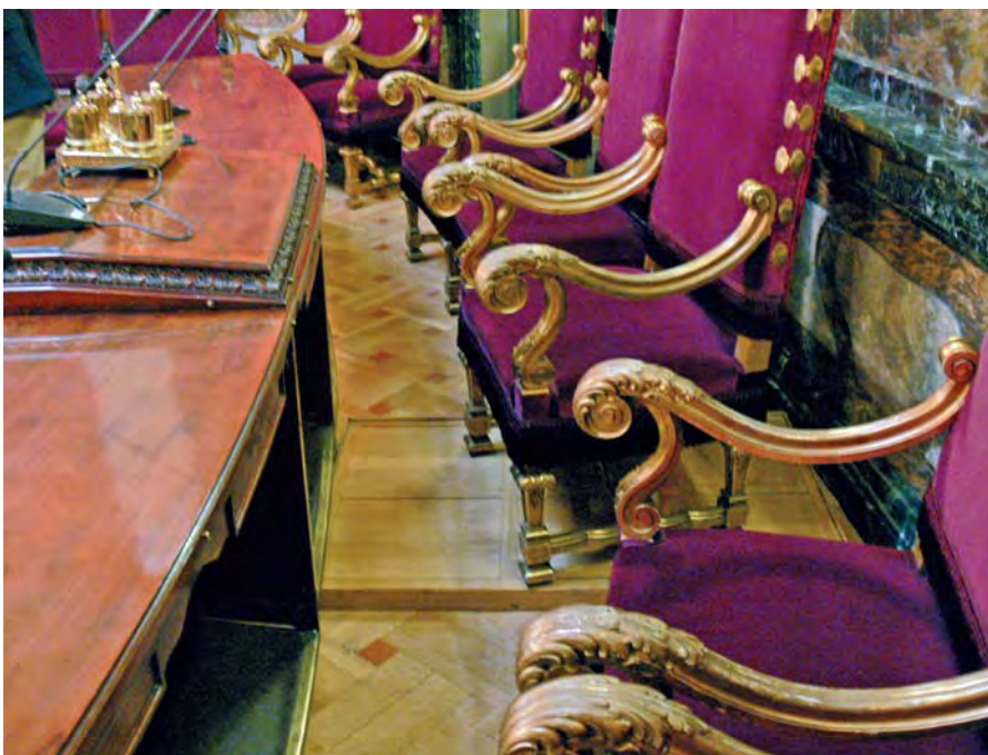
Sala de plenos del Tribunal Supremo. Detalle con la plataforma en que se coloca el sillón del Presidente.

El grabado de la Grand'Salle del Palacio de Justicia francés está tomado de la obra citada Le Palais de Justice de Paris. Son monde et ses moeurs . El de la sala de la Chancillería vallisoletana pertenece a una edición de la obra citada Práctica y formulario de la Chancillería de Valladolid , hecha en Zaragoza en 1733. El autor de la caricatura es Segundo Prada. Y las otras dos imágenes forman parte del archivo del autor del artículo.