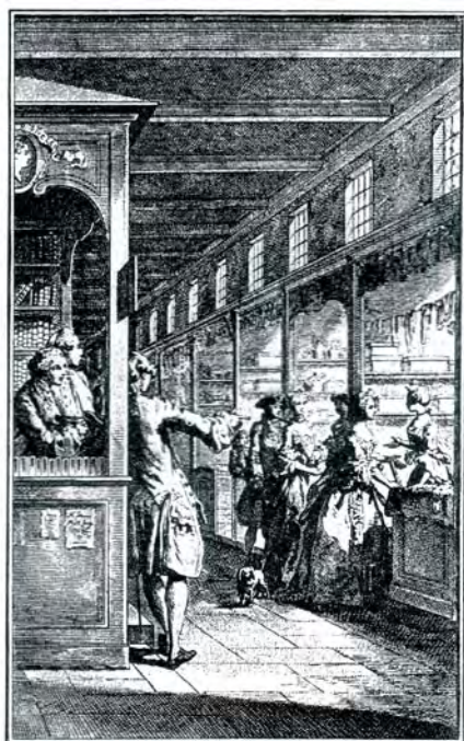
Tiendas en la Grand'Salle del Palais de Justice de París durante el siglo XVIII.

Y los templos cristianos mantuvieron el carácter de lugares de reunión civil. En el Madrid del Siglo de Oro, la iglesia de San Felipe el Real, situada cerca de la Puerta del Sol y hoy desaparecida, acogía debajo de su lonja un buen número de tiendas comerciales, y sus escalinatas congregaban