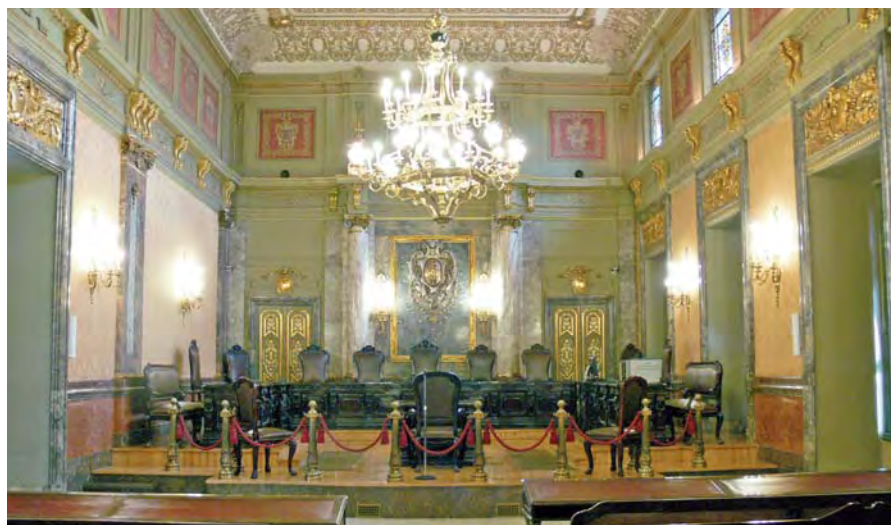
Sala de audiencia del Tribunal Supremo. El estrado, aislado por un cordón rojo y la altura.

La similitud de las salas forense y religiosa pudiera ser más que casual si tenemos en