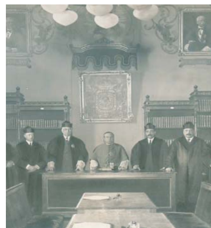
Junta de Gobierno del Colegio de Abogados de Valladolid en su antigua sede de la Chancillería. La presencia del Arzobispo manifiesta la vinculación con lo religioso.

mismo mal, si hemos de dar fe a lo que nos dice de ellos Jean-François Lacan: 10 "Basta frecuentar las salas de audiencias para percibir que la cortesía, virtud profesional de la que se vanaglorian frecuentemente los jueces, ya no se usa. Ironizan, muestran impaciencia, humillan, no dejan pasar ocasión de mostrar su superioridad. En numerosos procesos penales, se ve al presidente hablar con sus asesores o poner cara de dormidos cuando el defensor del acusado alega. ... Y en las audiencias civiles, los jueces no se privan de reprender a los abogados sobre el contenido de sus argumentos como si se dirigiesen a alumnos cogidos en falta".