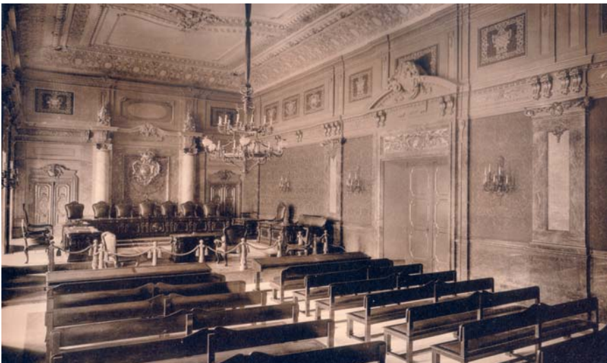
Sala de lo Contencioso-Administrativo del Tribunal Supremo en 1927. La semejanza con el espacio de una iglesia es evidente.

Trescientos años antes, en 1597, Jerónimo Castillo de Bobadilla, fiscal de la Real Chancillería de Valladolid, asignaba a los jueces no sólo la condición de ministros de Dios, sino la de dioses mismos: 3 “no solamente los Reyes y grandes Monarcas, sino también los jueces son ministros de Dios, y por Dios ejercen sus oficios y disciernen las cosas justas, los cuales no sólo representan al Príncipe terreno que los puso y constituyó en los juzgados y corregimientos, pero son