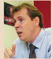
D. Óscar Puente