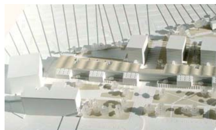
Vista parcial del proyecto de la Ciudad de la Justicia de Vigo.