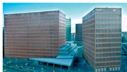
Ciudad de la Justicia de Barcelona.