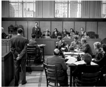
Sala de vistas de la película La costilla de Adán , de George Cukor. Muestra materializado el esquema de la sala de vistas típica norteamericana.

El vigente estatuto general de la abogacía, aprobado por Real Decreto 658/2001, de