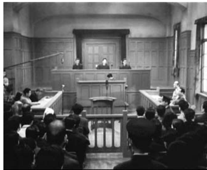
Sala de vistas de la película japonesa Escándalo, de Akira Kurosawa. La distribución espacial del estrado es prácticamente igual al de las salas de vista españolas. Pero los clientes se encuentran junto a sus abogados, los más próximos a la mesa del tribunal.

De acuerdo, pues, con el derecho de defensa, que la jurisprudencia califica con el ampuloso epíteto de “sagrado” 8 , el “más