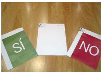
Papeletas con que los congresistas daban su conformidad, abstención o rechazo a las conclusiones votadas.

En la primera ponencia sobre “Libertad y seguridad, aspectos básicos del Estado de Derecho” las conclusiones se refieren a aspectos como la necesidad de garantizar la libertad y la seguridad, la lucha contra el terrorismo desde el respeto a la ley, la inmigración, la Corte Penal Internacional, los derechos de las personas privadas de libertad, la reforma de la Ley de Enjuiciamiento Civil, el secreto profesional, el derecho de la defensa, la asistencia jurídica gratuita y el Turno de Oficio, la difusión de información veraz y la deontología profesional.