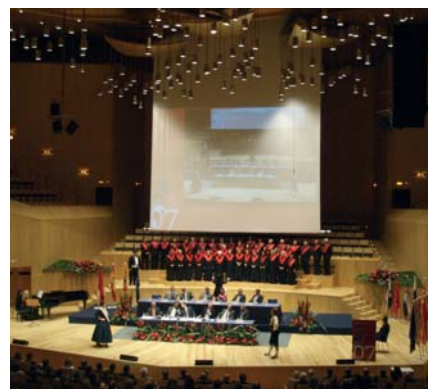
Inauguración del Congreso de Zaragoza.

Tras dos intensos días de intensos debates la labor de los congresistas quedó reflejada en las Conclusiones de las dos Ponencias. En el IX Congreso de la Abogacía se aprobaron 78 Conclusiones sobre los temas tratados en las ponencias.