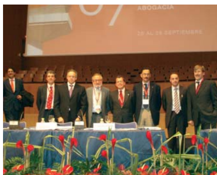
Varios de los ponentes y presidente de la Mesa a la finalización de la II ponencia.