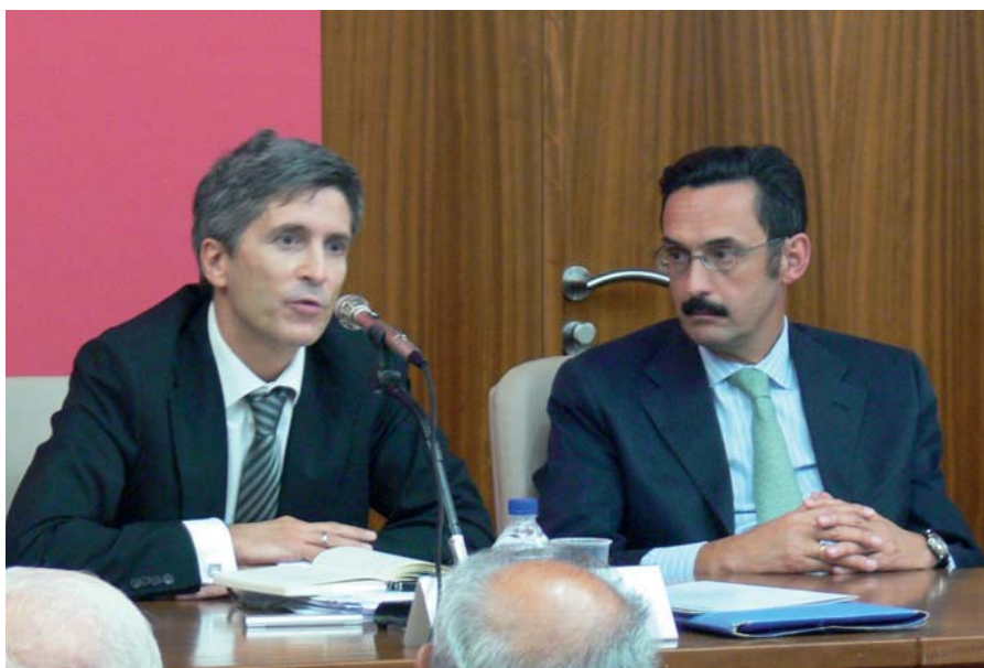
El magistrado de la Audiencia Nacional D. Fernando Grande Marlaska en su discurso de apertura de la Escuela de Práctica Jurídica y el Decano.

En el acto de clausura del Congreso el Ministro de Justicia Mariano Fernández Bermejo expresó su deseo de lograr una abo-