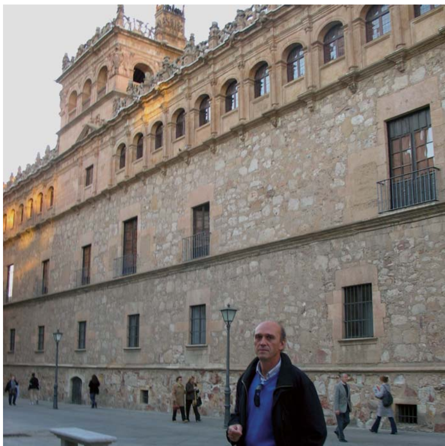
El Palacio de Monterrey, edificio de estilo renacentista. Su arcada, denominada "El pasadizo de las damas", de estilo italiano es muy similar al de la Academia de Caballería de Valladolid. Frente a él encontramos el convento de la "Purísima".