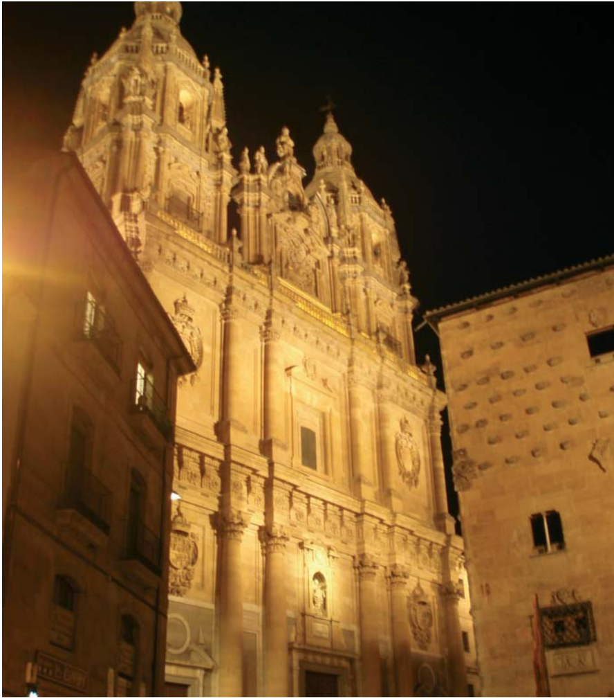
La Clerecía al anochecer flanqueada por dos torres que compiten en belleza con la Catedral. Este edificio fue iniciado en 1617 por iniciativa de Felipe III. Contiene una iglesia de estilo sintético entre el herreriano y el barroco. La Casa de las Conchas se posiciona ante la Pontificia, cuya singular ornamentación de veneras hace de ella un edificio único e inconfundible