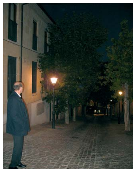
La Cuesta de Carvajal, uno de los rincones con mayor encanto de la ciudad. Aquí se rodó la película Nueve Cartas a Berta de Basilio Martín Patino.