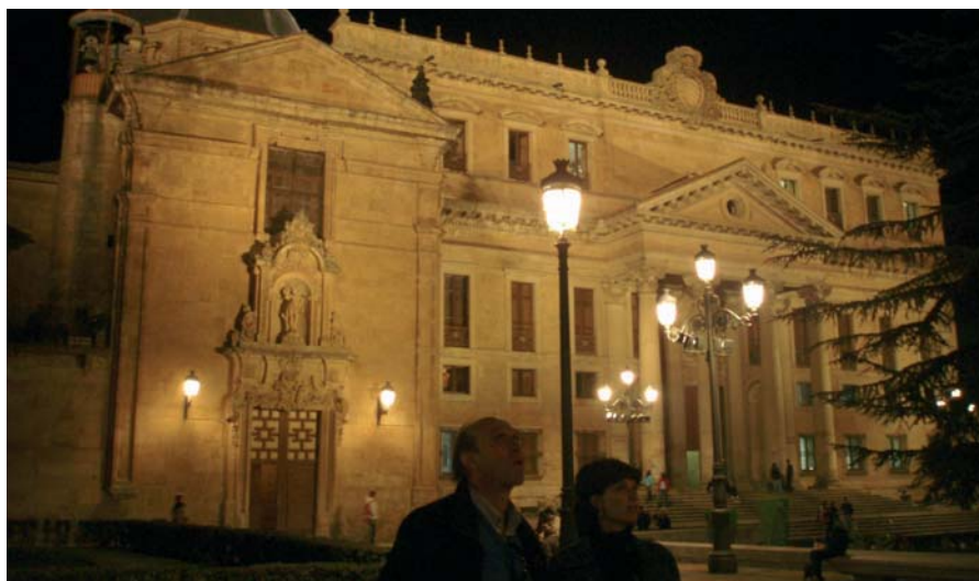
Desde La Plaza Anaya se puede contemplar el conjunto catedralicio en todo su esplendor: El Colegio Anaya posee un patio neoclásico de proporciones y ritmo difícilmente igualables, construido a finales del siglo XVIII.

Qué decir de todo este esplendor, haber crecido entre estas calles, sentir el reflejo del color de la piedra de Villamayor, degustar la carne de Morucha y los hornazos, endulzarse con los chochos y almendras garrapiñadas. Y regalar los pendientes y anillos charros a la enamorada. Francisco Salinero siente un tremendo apego a esta tierra, de la que guarda gratos recuerdos. Pasear junto a este ilustre guía es enamorarse de una Salamanca diferente, divertida, bella, cercana. Hay que acercarse a esta ciudad para ser protagonistas del hechizo que sintió Cervantes.